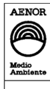
AENOR – Medio Ambiente